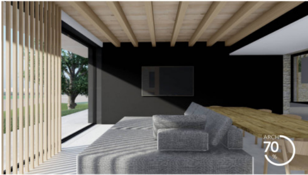
RENDERING DI PROGETTO, INTERNI, APPARTAMENTO 3