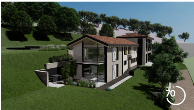
RENDERING DI PROGETTO