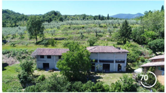
2. STATO DI FATTO