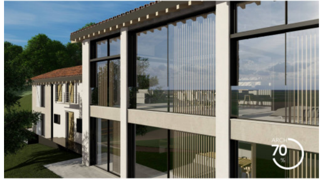
RENDERING DI PROGETTO