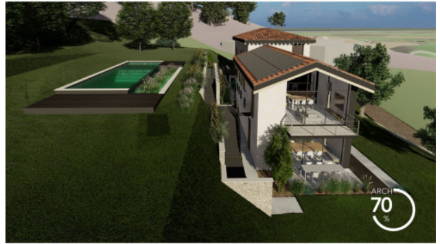
RENDERING DI PROGETTO