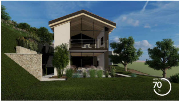
RENDERING DI PROGETTO