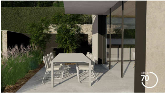
RENDERING DI PROGETTO