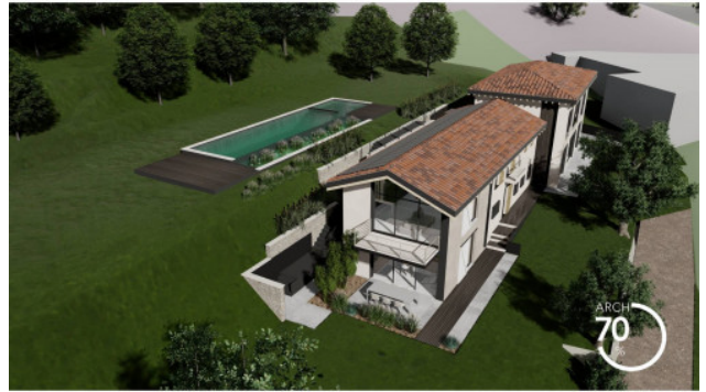
RENDERING DI PROGETTO