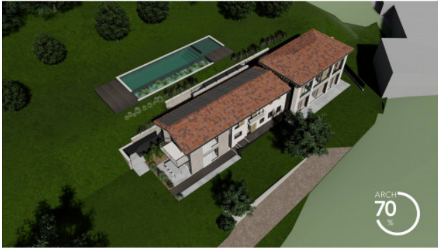
RENDERING DI PROGETTO