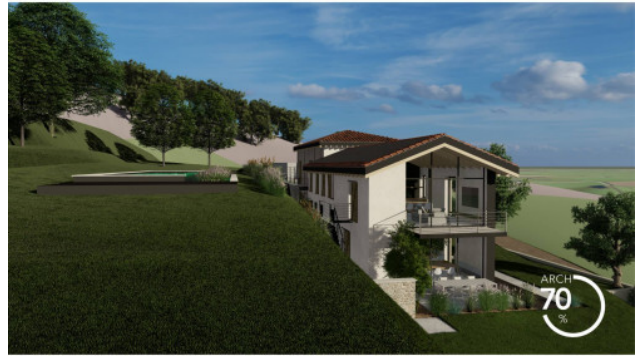
RENDERING DI PROGETTO