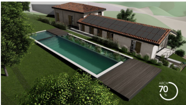
RENDERING DI PROGETTO