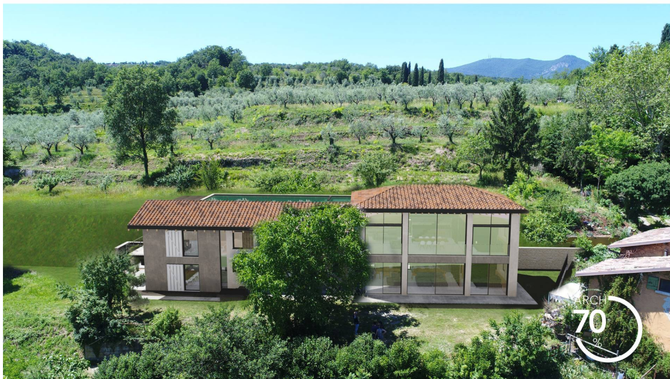
2. FOTOSIMULAZIONE DI PROGETTO