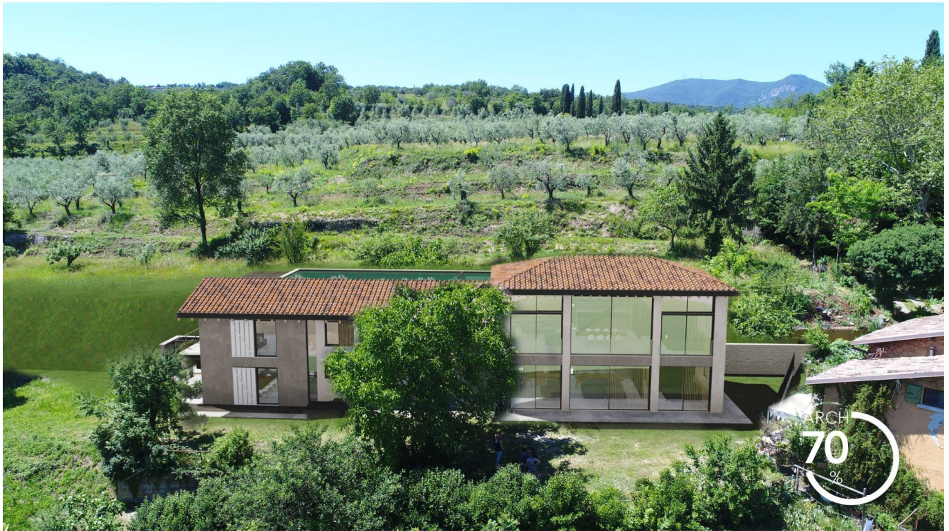
2. FOTOSIMULAZIONE DI PROGETTO