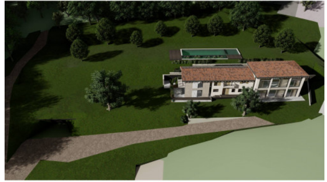
RENDERING DI PROGETTO