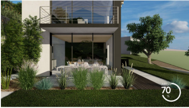
RENDERING DI PROGETTO