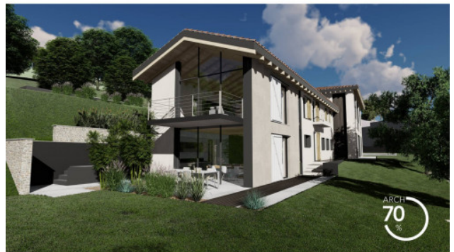
RENDERING DI PROGETTO