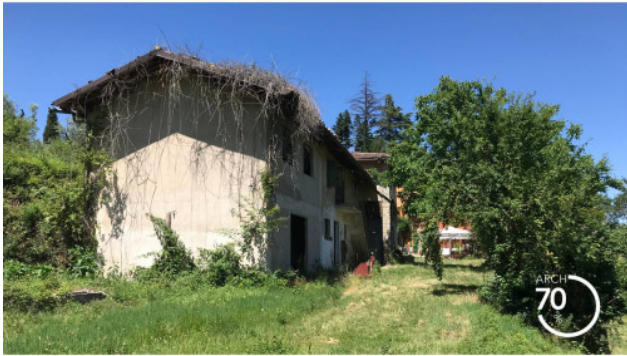
5. STATO DI FATTO