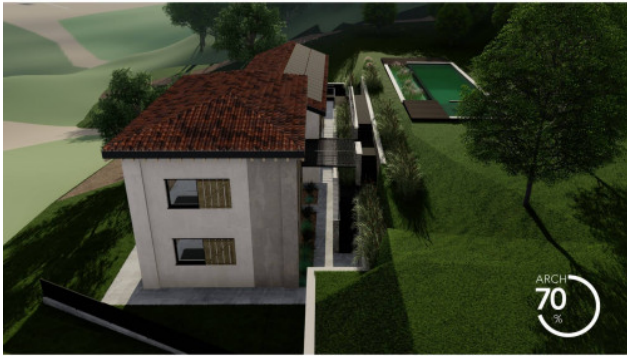
RENDERING DI PROGETTO