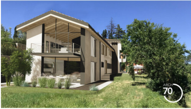
5. FOTOSIMULAZIONE DI PROGETTO