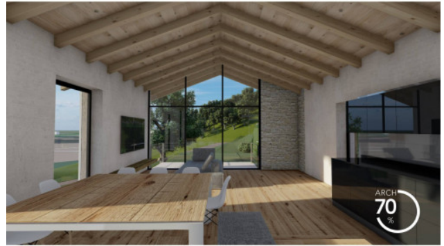
RENDERING DI PROGETTO, INTERNI, APPARTAMENTO 4