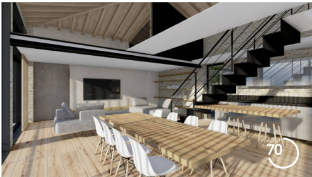
RENDERING DI PROGETTO, INTERNI, APPARTAMENTO 5