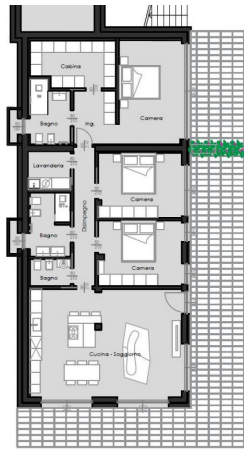
Pianta piano terra arredato - scala 1:100